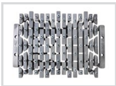
Kernsatz für einen Verfüllziegel