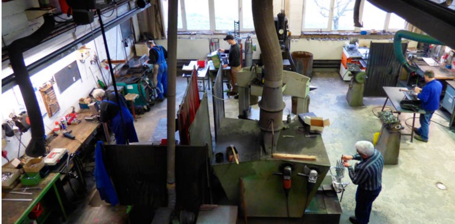
Mitarbeiter der Firma KAMPEN bei der Herstellung von Mundstückteilen und Reparaturen