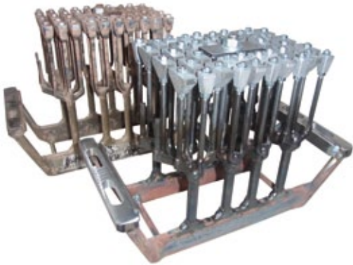
Zwei Kernsätze vor und nach der Reparatur

Wir bieten Ihnen so eine ganzheitliche Lösung aller ihrer formgebungs- und verfahrenstechnischer Problemstellungen, auch unter Einbeziehung des HÄNDLE-Labors in Mühlacker. Zudem ist der Standort Bad Salzuflen regional, d.h. für den Norden und Osten Deutschlands sowie die Niederlande und Belgien, Ihre zentrale Anlaufstelle für die Verschleißoptimierung und die Regenerierung von Verschleißteilen.