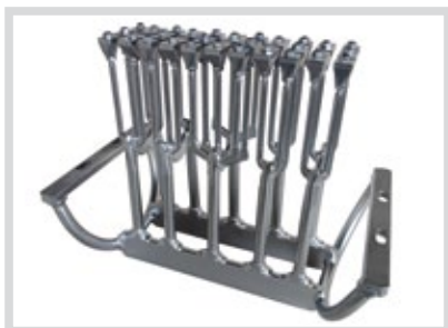
Kernhalter für einen Lochklinker

KAMPEN fertigt in enger Zusammenarbeit mit dem Kunden Mundstücke nach Zulassung oder Produkthanforderungen. Die Mundstücke werden je nach Kundenanforderung mit Bewässerungs- und Austrittsrahmen ausgeführt. Diese werden mit Einlagen aus verschleißfestem Stahl oder in hartverchromter Qualität ausgeschlagen. Der Austrittsrahmen kann auch als Werkzeugstahlrahmen ausgeführt werden.